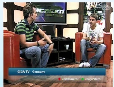
Live aus dem Netz: Der Receiver bringt Web-TV-Streams von Giga & Co. auf den Fernseher